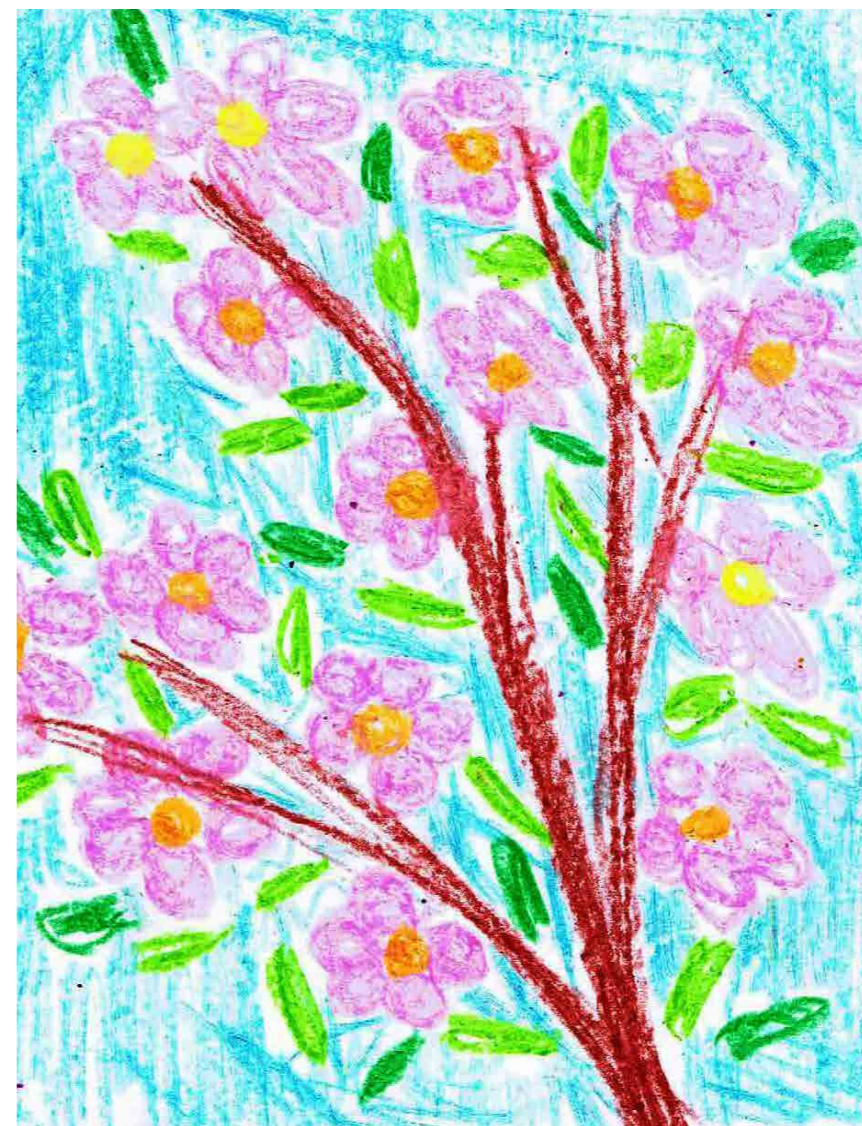
↑ Даша Х.