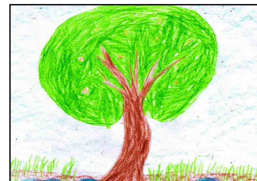
↑ Варя (8 лет)