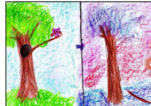
↑ София (11 лет)