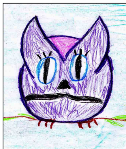
↑ Ксения (12 лет)